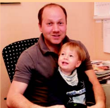
Die zweite und dritte Generation Köser

... bei der Handwerkskammer eingetragener Fliesen-, Platten- und Mosaikleger