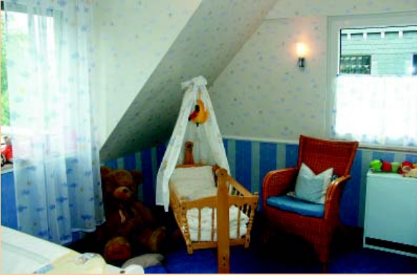
Wandflächen mit Tapeten unterbrochen durch ein umlaufendes Stuckprofil