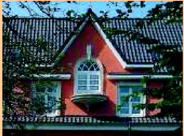
Wärmedämmverbundsystem mit Deco Profilen und Bossensteinen