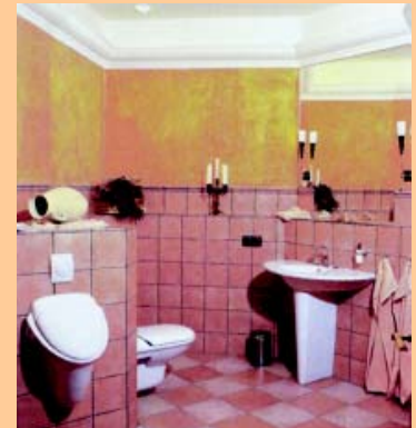
Umlaufendes Stuckprofil, indir. Beleuchtung, Wandfläche glatt mit einer Wischtechn., Fliesen mit Ompronta