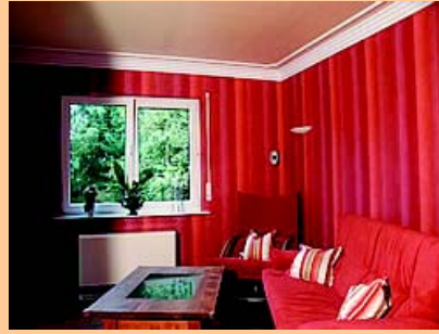
Deckenflächen glatt glänzend mit umlaufendem Stuckprofil Wandflächen mit Marmorimitation in gelb und Tapeten in rot Bodenfläche mit Parkett Buche Mahoganie