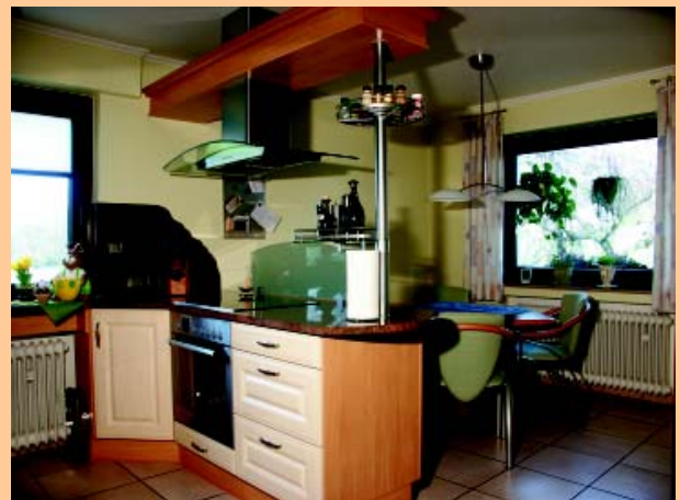
Deckenfläche glänzend mit umlaufendem Stuckprofil, Wandflächen mit Tapete und getöntem Anstrich