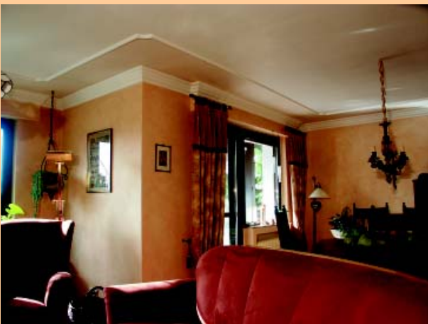
Decke u. Wände glatt, Wandflächen mit einem Lasurauftrag, umlaufendem Stuckprofil in der Ecke und auf der Deckenfläche