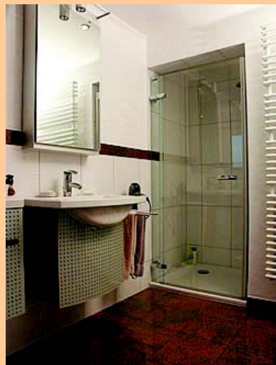
Deckenfläche glatt mit umlaufendem Stuckprofil, Wandgestaltung mit Modellierputz in grob weiss, Wandfliesen mit Venis, Bodenfläche, Borde und Ablagen mit Multicolor Red