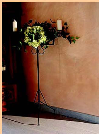
Wandgestaltung mit Modellierputz in grob, mit einer Lasurbeschichtung Bodenfläche und Sockel mit Italgraniti