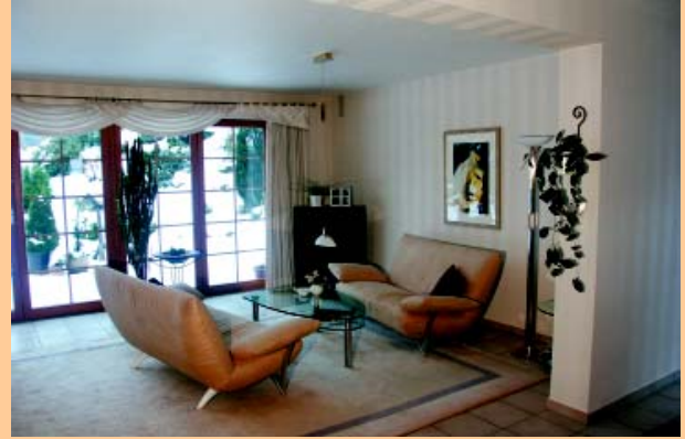
Wandflächen mit Capaquarz und einer Lasurbeschichtung