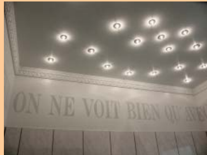
Decke u. Wände glatt mit Effektbeschichtung, umlaufendem Stuckprofil und Spruchband