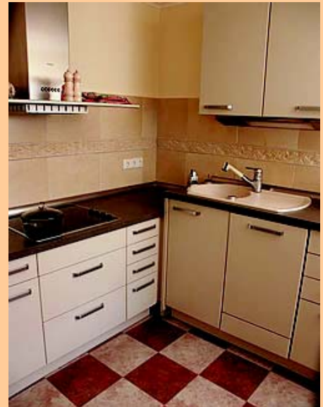
Decken – und Wandfläche Tapeten mit farbiger Beschichtung, Wand- fliesen mit Venis, Bodenfläche Carat-Fliesen als elastischer Belag