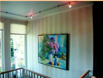
Deckenfläche glänzend mit umlaufendem Stuckprofil Wandflächen mit Capaquarz und einer Lasurbeschichtung